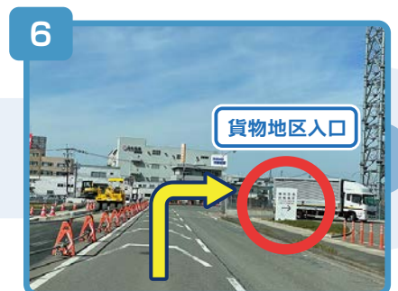
貨物地区入口の看板が右手に見えてきます。

※貨物地区入口よりお進みいただいた後、<国内線側からお車でお越しの場合>の13～15に沿ってお進みください。