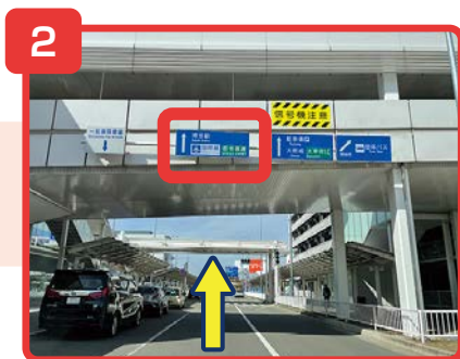
博多駅方面に直進します。