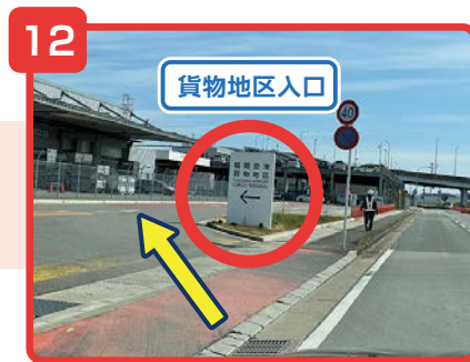
貨物地区入口の看板から入ります。