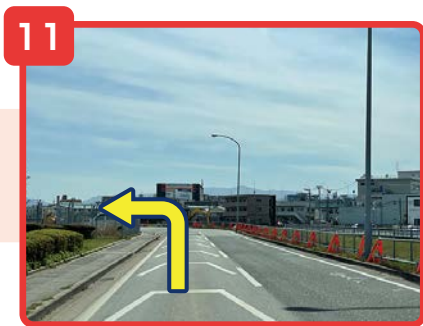
直進しカーブを曲がると左手に貨物地区入口の看板が見えてきます。